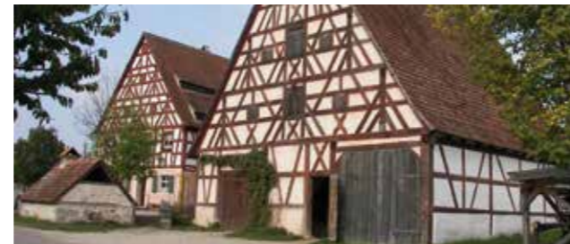
Michaela Stüb / pixelio.de

Mitbringen: Rucksack oder Tasche Getränk Taschen-Geld (z. B. für ein Eis) Sonnen-Schutz Festes Schuh-Werk